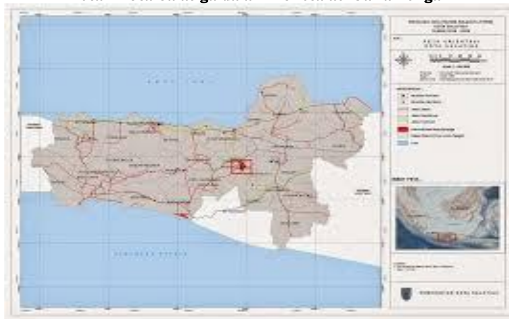
Gambar I.2 Letak Kota Salatiga dalam Konstalasi Jawa Tengah